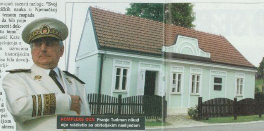
KOMPLEKS OCA: Franjo Tuđman nikad nije raščistio sa obiteljskim naslijeđem