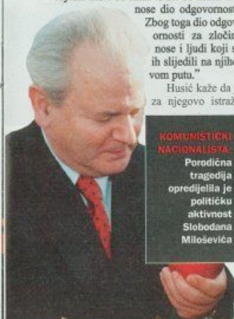
KOMUNISTIČKI NACIONALISTA: Porodična tragedija opredijelila je političku aktivnost Slobodana Miloševića

historijskim mitovima te milje iz kojeg je isplivao kao srbijanski vođa. "Mislim da je za njegov psihološki profil najvažnije odakle potiče i zašto su ljudi baš njega podržavali, a ne nekog drugog, umjerenijeg političara. Stoga se, u ovom slučaju, može govoriti o psihopatologiji većine u Srbiji", tvrdi Husić. "Međutim, radeći na njegovom profilu shvatio sam kako u svemu tome postoji nešto skriveno, nešto misteriozno a što bi trebalo dati odgovore na pitanja o uzrocima i načinu njegove vladavine." Ne želeći, ipak, cjelokupnu odgovornost za ratove prebaciti isključivo na pleća Miloševića i Tuđmana, dodaje kako je njegova knjiga "jedan od načina da se objasni ono što se zbivalo, da se objasni zašto su činili to što su činili. Oni nose dio odgovornosti. Zbog toga dio odgovornosti za zločine nose i ljudi koji su ih slijedili na njihovom putu."