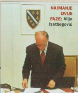
NAJMANJE DVIJE FAZE: Alija Izetbegović

Izetbegović je ozbiljno bio uvjeren kako će mu svijet pomoći da očuva Bosnu. Ali, kada je bilo jasno da pomoć neće dočekati, kod njega se nešto mijenja i to se najbolje vidi iz ponašanja pred oficirima i vojnicima Armije BiH. Pisao sam i pratio o negativnim stranama njegove vladavine, kakve su, recimo, operacije grupe Ševe i ostalim kontroverzama, no mislim da je najvažnije da je on iz sebe uspio ostaviti državu, ma kakva bila. Pokušao sam da budem kritičan koliko to mogu. Međutim, nisam htio da sebi namaknem okove i da prestanem da pišem ono što sam morao napisati, bez obzira što postoji opasnost da mi sa srbijske ili hrvatske strane prebace da sam jednostran."